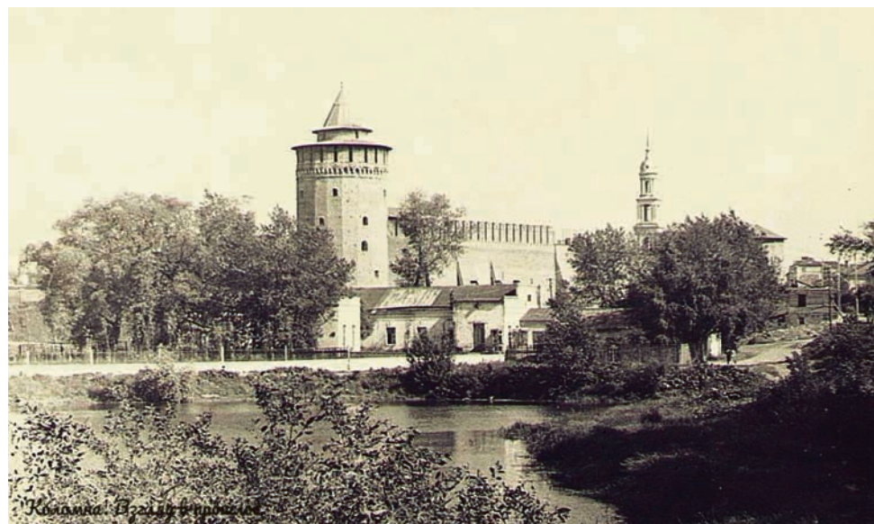
«Коломна. Взгляд в прошлое». Реставрация Кремля. 1970-е годы.

тогда, в 70-е. Административный корпус, широкоэкранный кинотеатр на 600